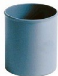
← Manchon à buté D100 n°1