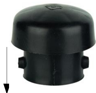
← Chapeau d'évent